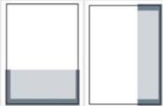
1/3 SEITE QUER ODER HOCH