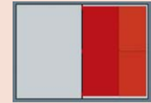
BEIHEFTER DIN A4