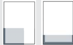
1/4 SEITE ECKFELD ODER QUER